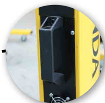
Poignée pour déplacer le chariot