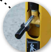
Manivelle pour le réglage de la hauteur