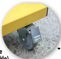
Roues pivotantes sur roulement avec système de freinage (selon modèle)