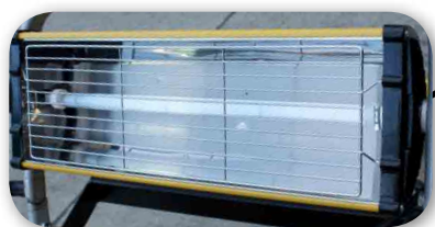
Tube rayonnant quartz halogène avec grille de protection